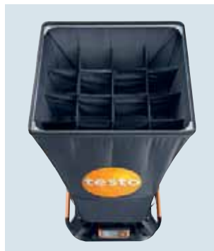
Strömungs-Gleichrichter für signifikant präzisere Messungen an Drallauslässen.