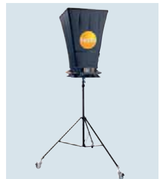
Stand sicheres und rollbares Stativ mit zentraler Aufnahme für sicheres Arbeiten bei hohen Deckenauslässen.