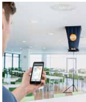
App-Anbindung über Bluetooth für Anzeige der Messdaten auf Mobilgeräten und Finalisierung des Messprotokolls vor Ort.